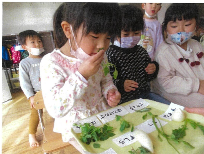
実際に見て、触って、香りもかいでみました。