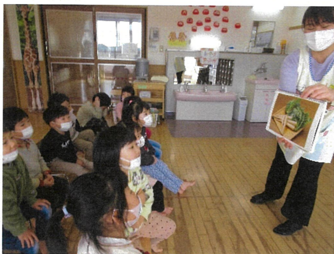
春の七草について聞いています